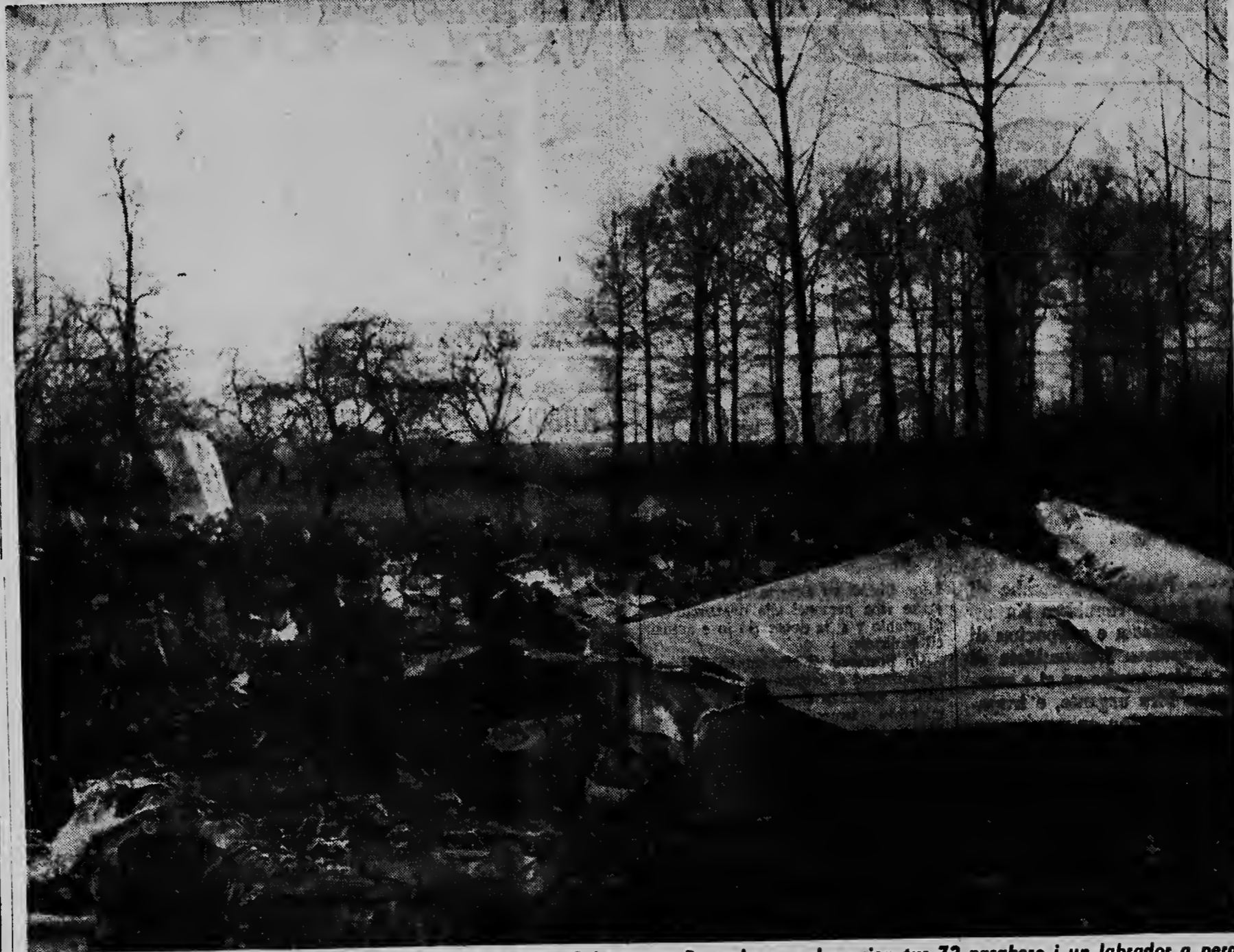
Aqui nos ta hanja un idea dje calamidad desastroso dje avion Sabena na Brussel na cual ocasion tur 72 pasahero i un labrador a perde nan bida. Nos ta mira e momento riba cual nan ta buscando victimanan dje horrible accidente aereo.